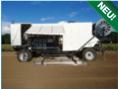
Dampfkessel S 1350 auf Vollautomat