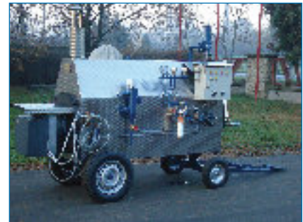
Kleindampfkessel MS 200