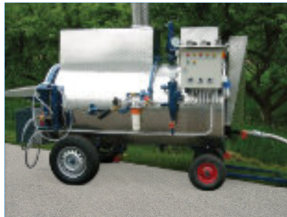
Dampfkessel S 350, fahrbar